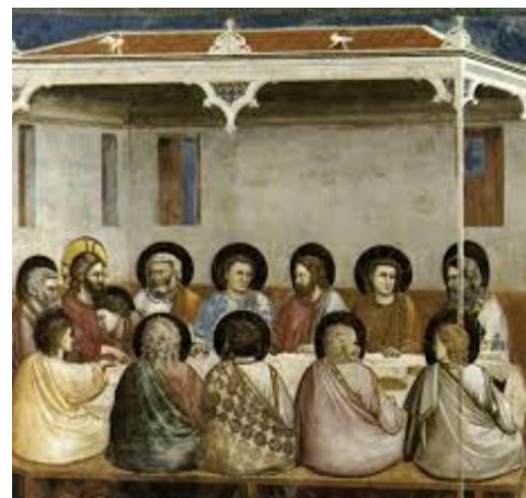
2. Ultima Cena