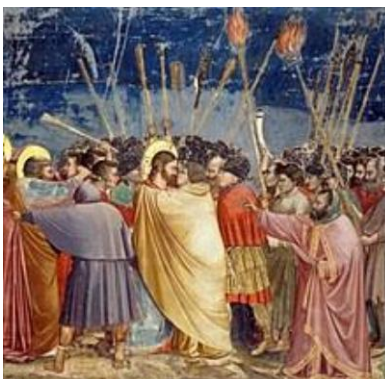
3a. Tradimento di Giuda