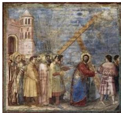
3b. Salita al Golgota