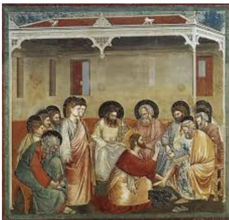
1. Lavanda dei piedi

Interessante la scelta dell'ambientazione: l'insegnamento di Cristo avviene in ambiente chiuso, domestico, in privato, nell'intimità di una relazione affettuosa di Gesù verso i suoi amici, compreso il traditore Giuda, identificato iconograficamente con la veste di colore giallo.